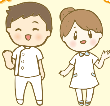
かいくん ここちゃん

福島県ナースセンター「かいくん」「ここちゃん」を今後とも何卒よろしくお願ひ申し上げます。