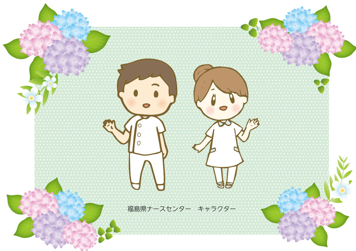
福島県ナースセンター キャラクター

発行所/公益社団法人福島県看護協会 福島県ナースセンター 発行/令和4年6月15日