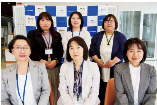
福島県ナースセンター

4月より3名の新職員が加わり、新体制となりました。お気軽にナースセンターまでご相談ください。