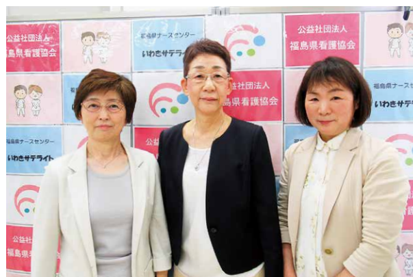
福島県ナースセンター いわきサテライト