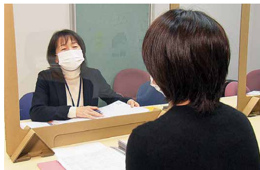
巡回就職相談会の様子

ハローワーク福島・ハローワークいわきは、事前に予約が必要ですので、ご予約をお願いします。