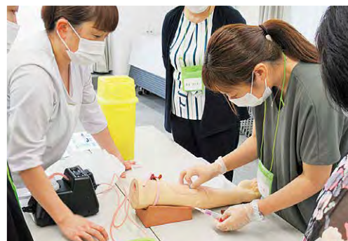
「採血・注射」の演習をする受講者