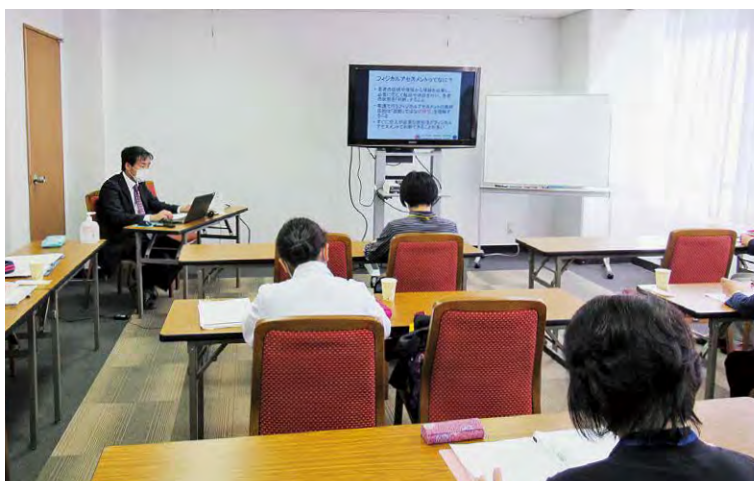
「フィジカルアセスメント」講義の様子

福島県から委託を受け「看護職の再就業支援研修」全2日間4コース（6月、8月、10月、11月）が終了しました。最新の医療・福祉・看護の動向・技術を学び自分に合った職場復帰に繋げることを目的に、郡山市（3回）と福島市（1回）で開催しました。講義演習の内容は「最新の医療・看護の動向」「フィジカルアセスメント」「医療事故防止」「院内感染対策」「注射・採血の実際」、「訪問看護に要する知識」です。受講者数は28名で、とても真剣に取り組まれていました。