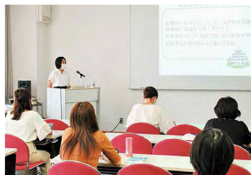
「院内感染防止」講義の様子